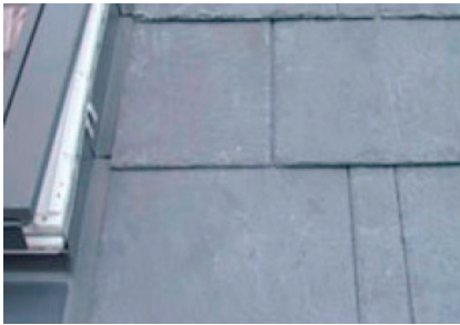
Figur 1. Korrekt afslutning med indskudt skiferstykke. Bemærk, at fastgørelse med kobbersøm holder længere (end fx rustfri søm) og så kan de fjernes med sømudtrækker.